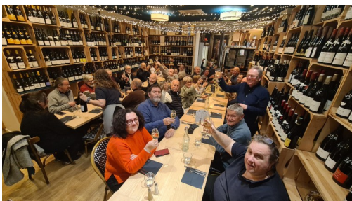
Belle soirée festive et chaleureuse

Vous avez peut-être vous-même des informations sur votre activité radio que vous aimeriez ou que vous pourriez faire partager. Faites-nous parvenir vos informations nous pourrions les publier.