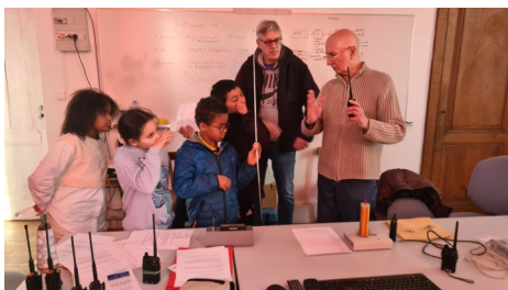
Découverte des ondes