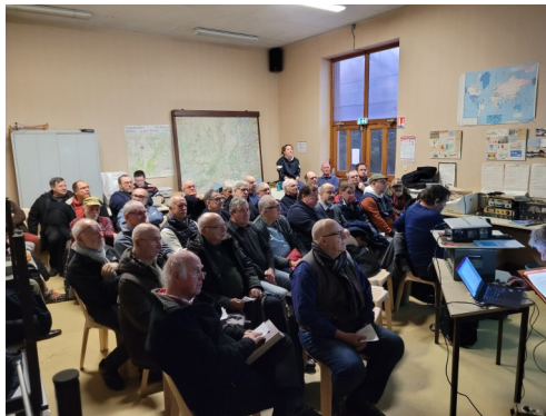
Une assemblée attentive

En décembre dernier nous nous sommes retrouvés plus de 30 convives OM et YL pour notre repas annuel. Ambiance joyeuse et conviviale dans un cadre agréable au restaurant le Tabagnon à Tassin-La-Demi-Lune. Nous avons ainsi clos une belle année pleine d'activité.