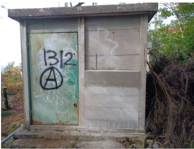
Le local après le travail d'Anthony F4JXH