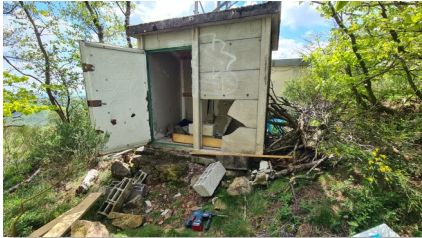
Le futur local du groupe électrogène, avant