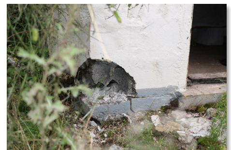
Sous la puissance de la foudre le bâti n'a pas résisté