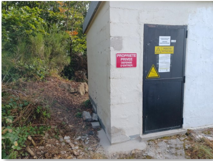
La base du local réparée par Anthony F4JXH