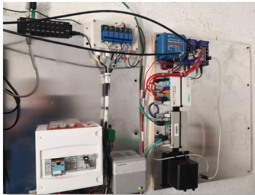
La partie réseau en cours de « recâblage » sur une TRP

Le relais lui-même a subi quelques avaries sur la carte logique, celle-ci étant connectée au réseau. Les autres paraboles ne semblent pas avoir été touchées, les vérifications continuent. L'antenne long fil connectée sur l'IC-705 a fondu à son extrémité, par chance l'IC-705 semble avoir été épargné, peut-être grâce au triplexeur, car celui-ci montre un impact de flash. Nous avons pu voir le trajet de la foudre au sol et à la base d'un arbre littéralement ouverte. Il reste encore à vérifier avec plus de précision les éléments qui semblent avoir été épargnés à première vue