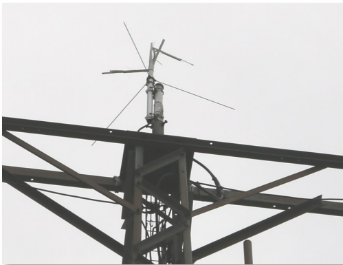
Ce qu'il reste de l'antenne foudroyée

Nous avons dû tout d'abord évaluer les dégâts. Non seulement l'antenne, mais toute la partie réseau a été atteinte, routeurs, switch, accessoires réseau, Gateway LoRa, station météo, alarme et autre circuiterie. Dans la violence de l'impact, un angle en parpaing au niveau du sol du local s'est volatilisé, une zone de parpaing entre les deux portes d'entrée a également éclaté.