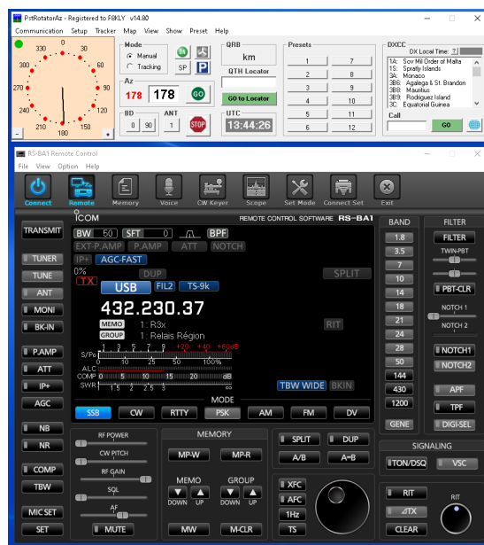
Le tableau de commande du TRX et du rotor d'antenne

Vous disposez ici d'une station dont le rotor d'antenne est également télécommandé. Il serait bien que cette station participe régulièrement avec des opérateurs aux soirées d'activités, soit directement à la station, soit en « remote »; elle porterait ainsi sur l'air la voix de F8KLY. La dernière soirée sur 432 MHz à permis de contacter en « remote » des stations des départements 13 - 30 - 63 84 et HB9, ce qui n'est pas si mal sur cette bande.