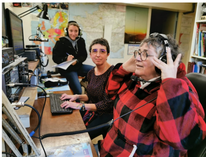
YL's on the air. Une équipe de charme et de choc

Surement la meilleure équipe. Souhaitons à cette belle équipe un magnifique « contest »