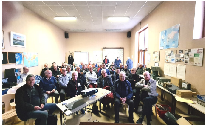
Une assemblée nombreuse et attentive

Le rapport financier de notre trésorier soumis aux votes a également recueilli l'unanimité des suffrages, moins une abstention