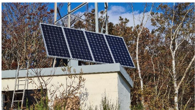
Les nouveaux panneaux sont posés

Nous avons traversé deux années particulièrement compliquées pour les associations, sans OND'EXPO. Je voudrais vous remercier tous, vous tous, adhérents du REF 69, remercier nos donateurs, dévoués à notre cause. Merci à vous pour votre présence et votre participation. Nous allons continuer notre travail, un travail en profondeur pour consolider nos acquis et notre présence. Pour que le monde radioamateur progresse nous devons nous rassembler, sans cela il n'y a pas d'avenir. Nous devons travailler la convivialité et les échanges entre le plus grand nombre. C'est pour cela que notre nouveau relais en préparation sera interconnecté au réseau ARA (Auvergne-Rhône-Alpes).