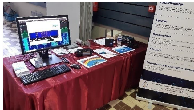
Le stand du REF 69 prêt pour l'ouverture