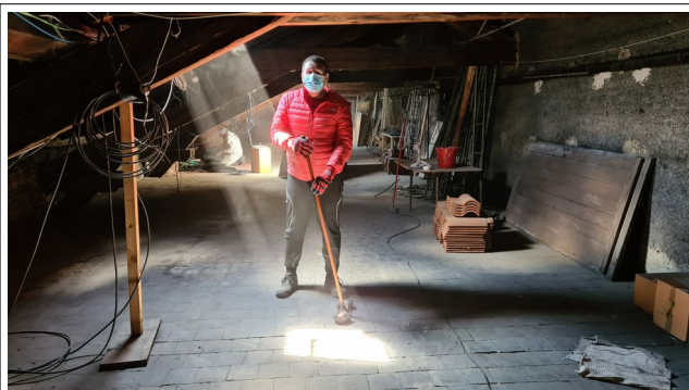
F4ITU après avoir balayé 300 m 2 de grenier.

Appel est lancé aux OM disposant d'une voiture à coffre, voire mieux, d'une remorque pour les excursions à la déchetterie.